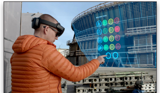
SYNCHRO Pro 属于 SYNCHRO 数字施工管理平台的一部分，该平台还包含混合现实和移动应用程序，以及项目协同管理云服务。